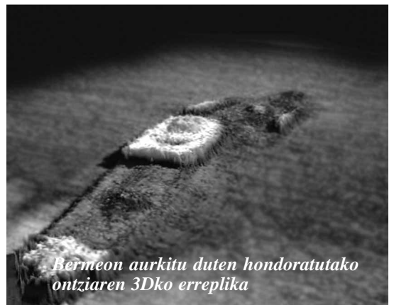
Bermeon aurkitu duten hondoratutako ontziaren 3Dko erreplika

Eusko Jaurlaritzako Nekazaritza Saileko Azti Teknalia Fundazioaren teknikariak