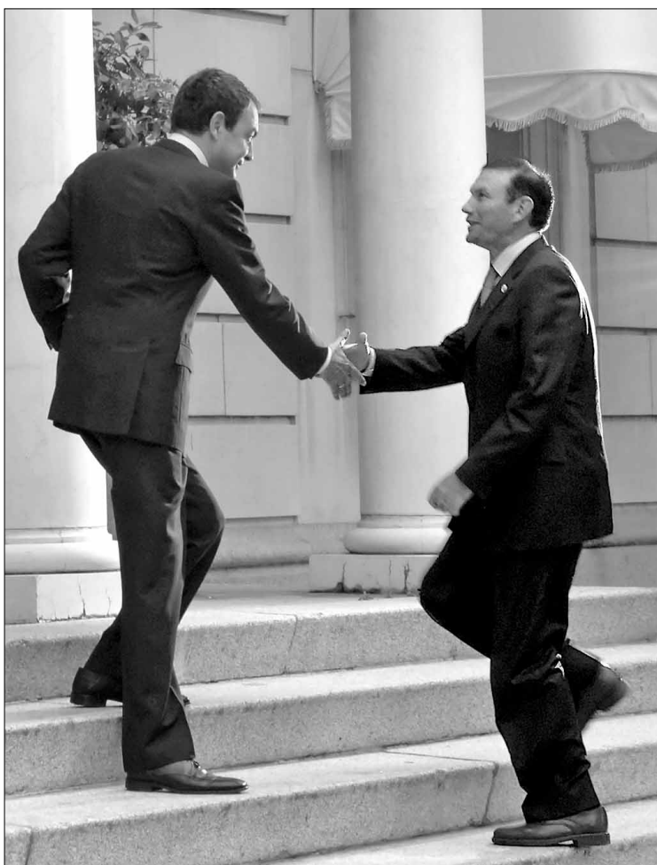
Zapatero e Ibarretxe se saludan en uno de sus últimos encuentros.

Ibarretxe se muestra convencido de que 2008 será el año del “desbloqueo” político